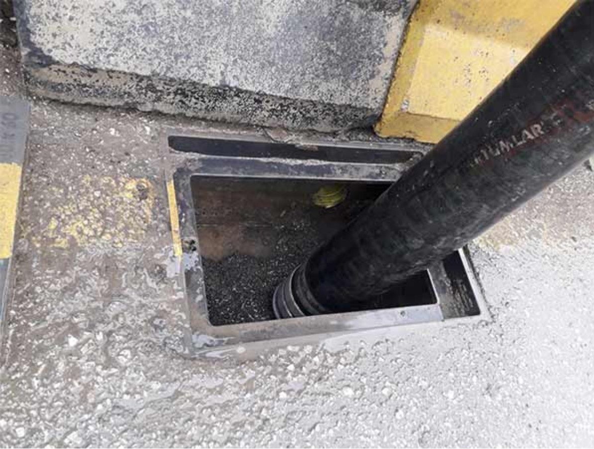
Kanal Tıkanıklığı Açma 7. Aşama