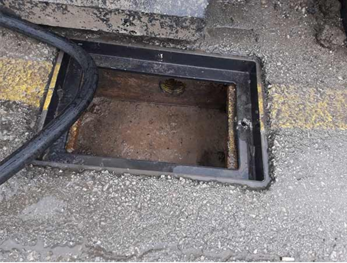
Kanal Tıkanıklığı Açma 9. Aşama