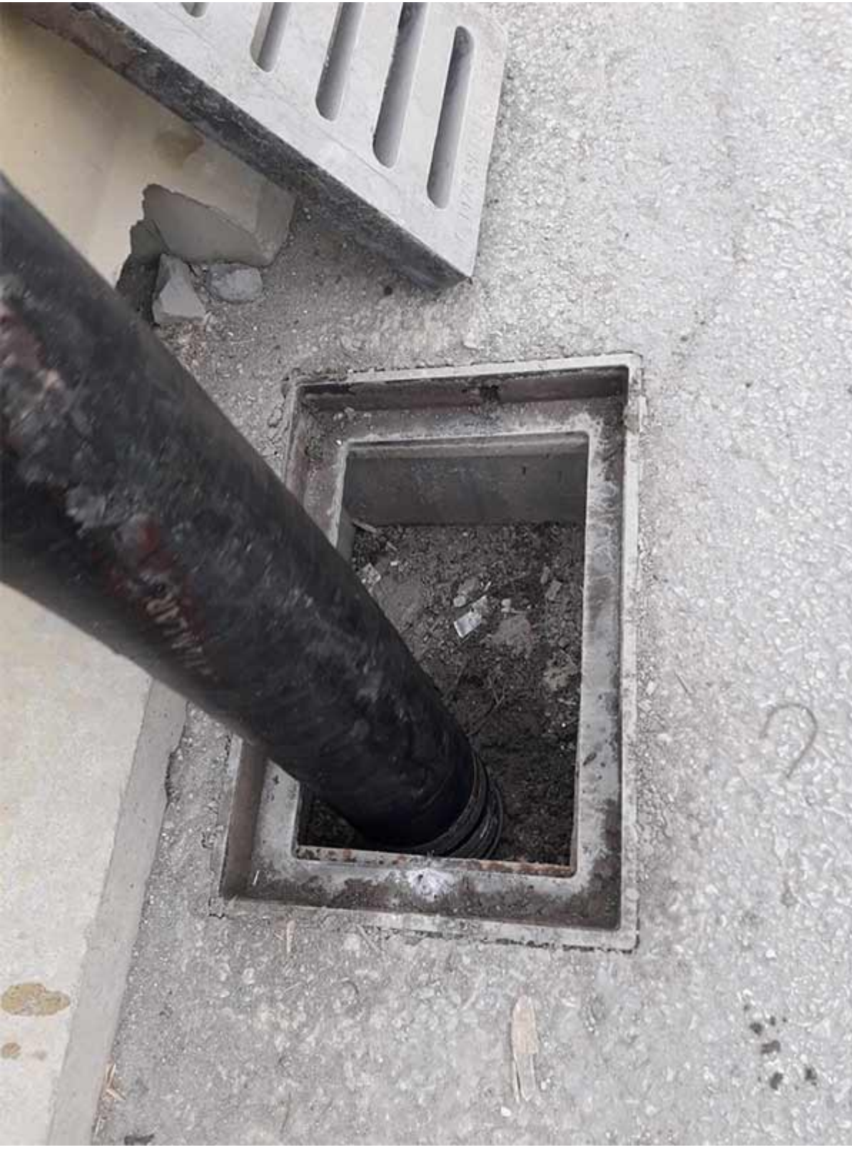
Kanal Tıkanıklığı Açma 3. Aşama