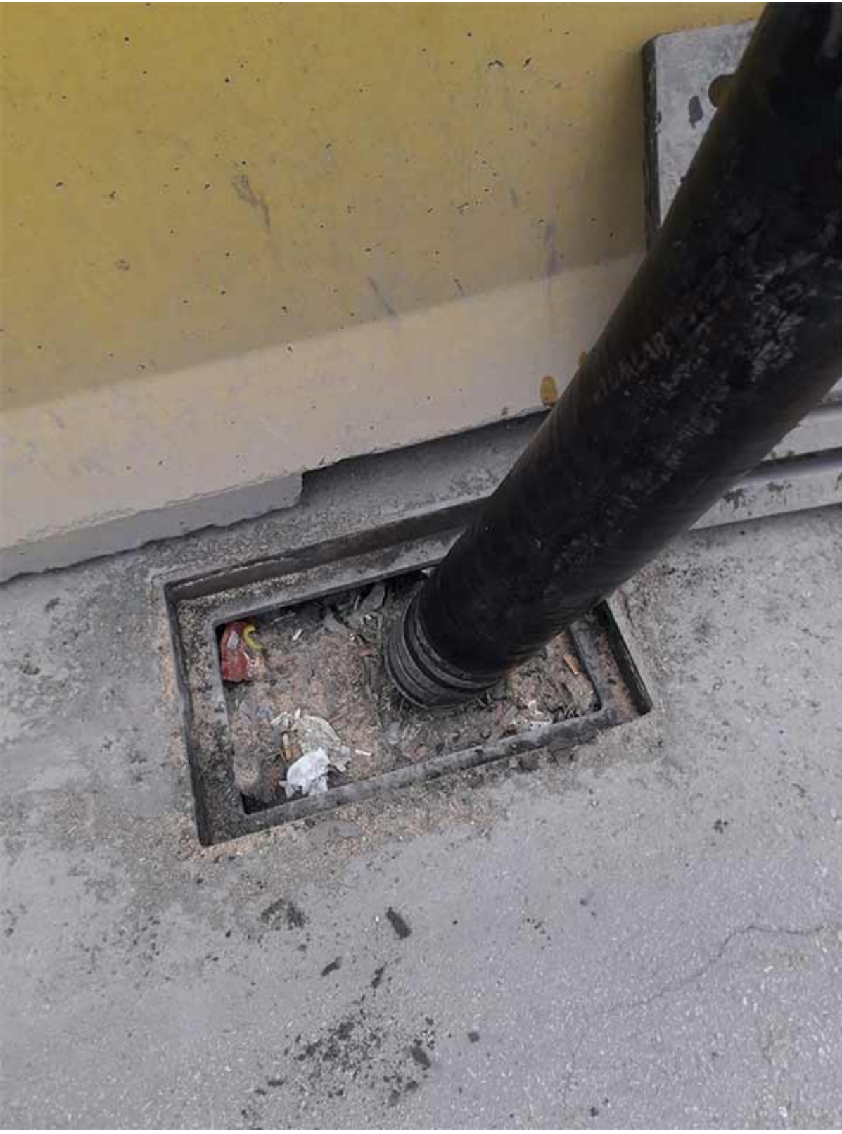
Kanal Tıkanıklığı Açma 4. Aşama