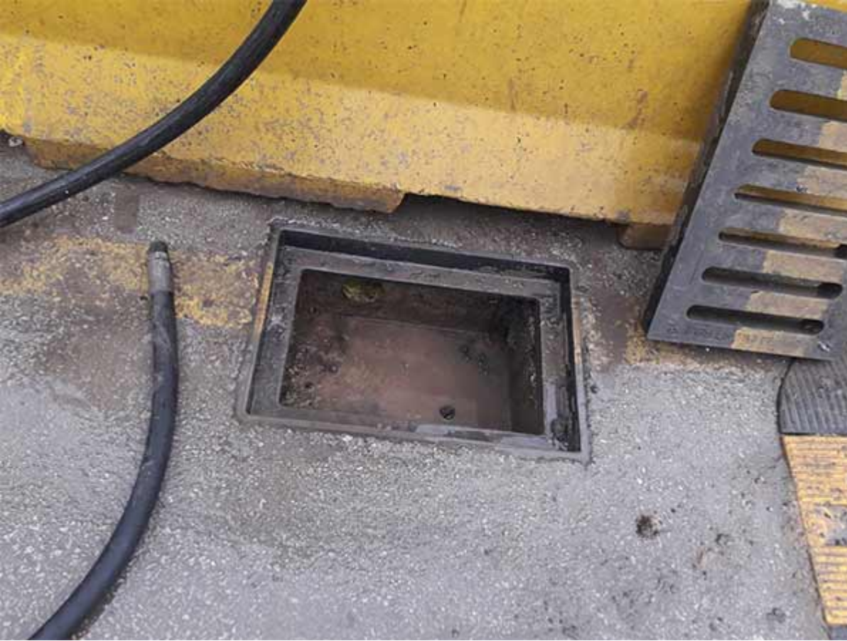
Kanal Tıkanıklığı Açma 10. Aşama