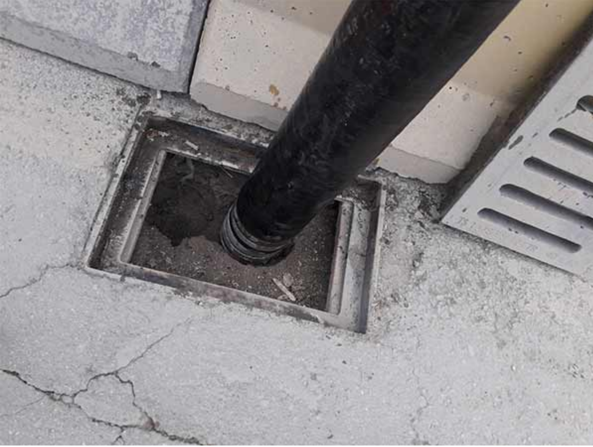
Kanal Tıkanıklığı Açma 6. Aşama