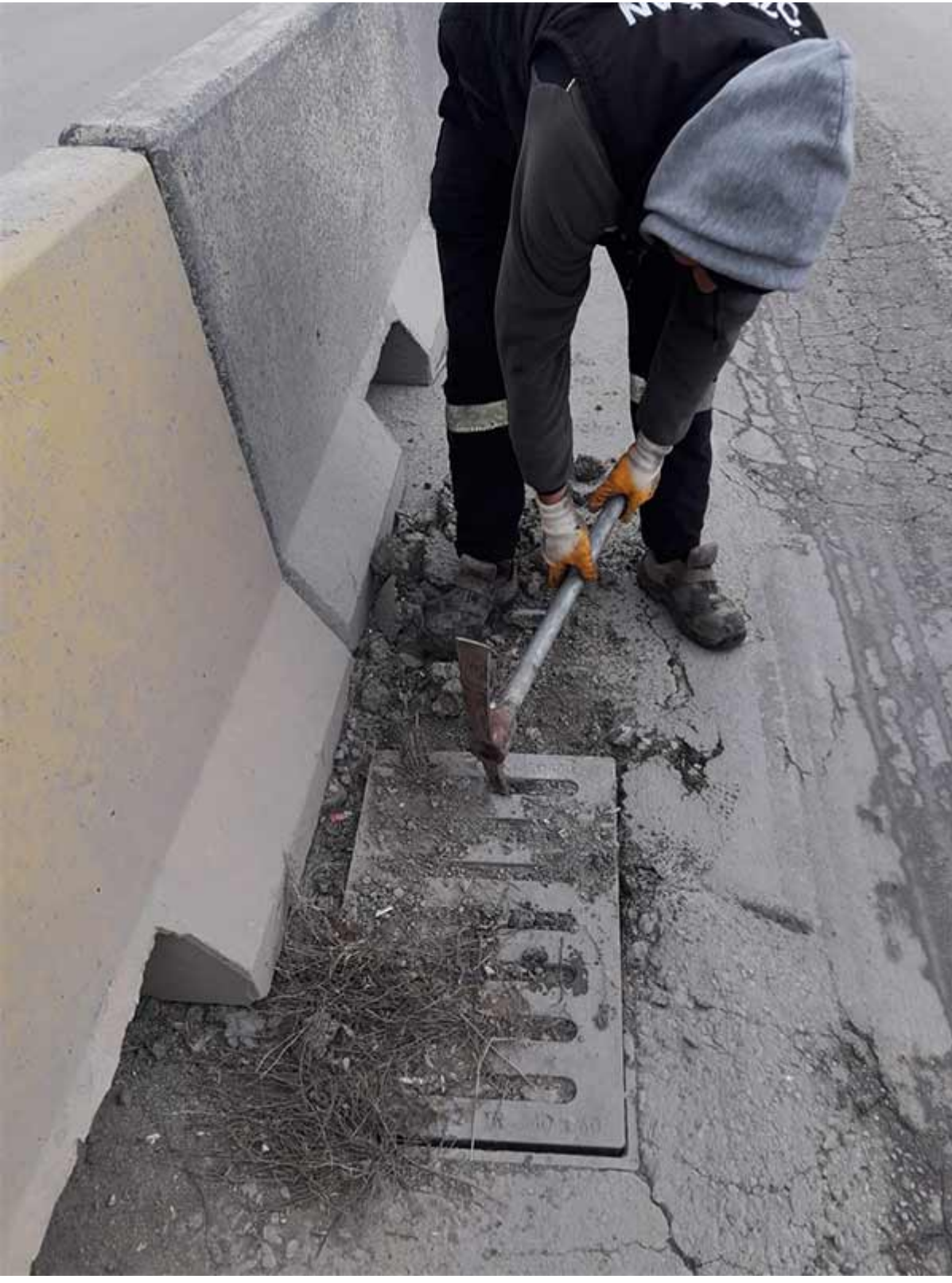
Kanal Tıkanıklığı Açma 2. Aşama