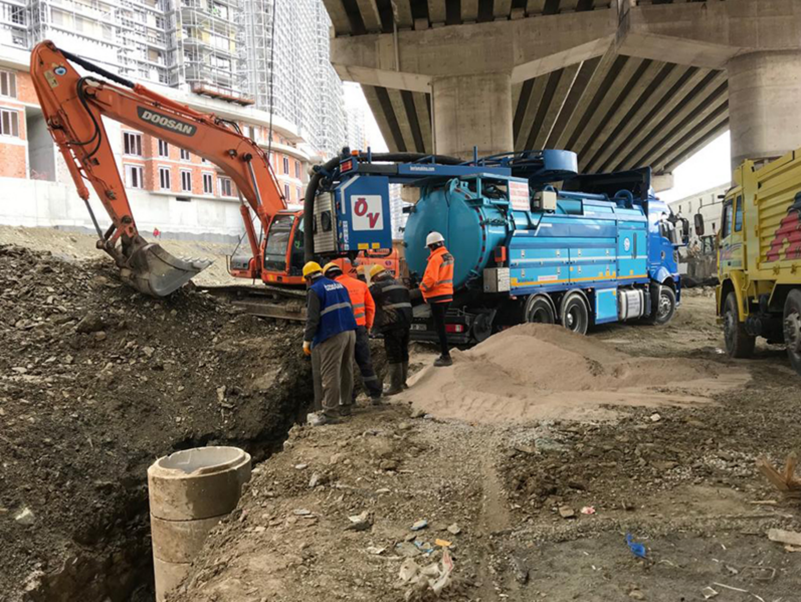
Kanalizasyon Hat Yenileme İşleri