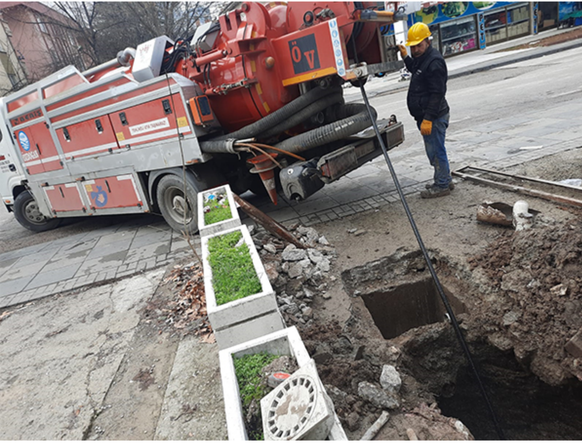
Kanalizasyon Açma Projesi (2)