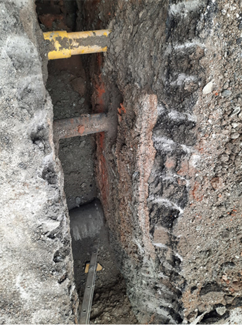
Kanalizasyon Hizmetleri 6. Aşama