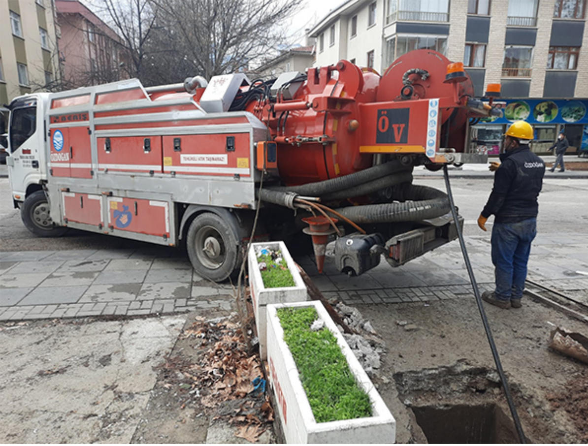
Kanalizasyon Açma Projesi (3)