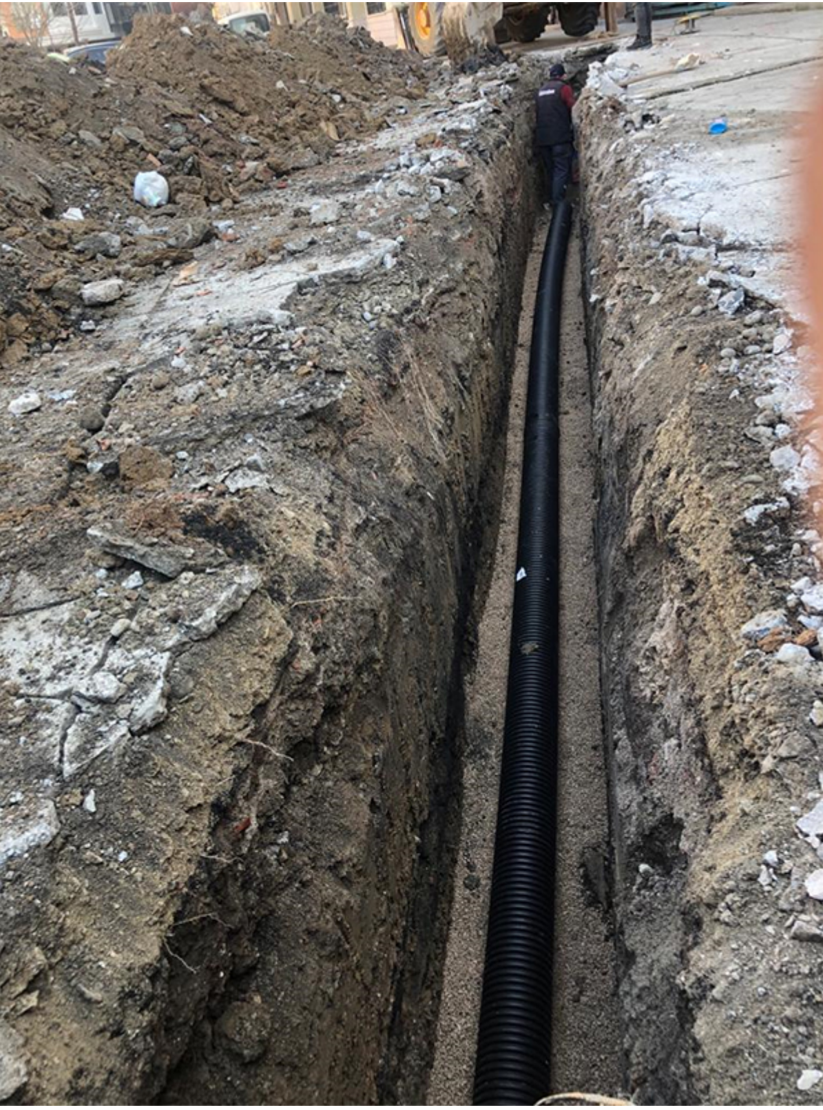
Kanalizasyon Açma, Yenileme ve Hat Döşeme 4. Aşama