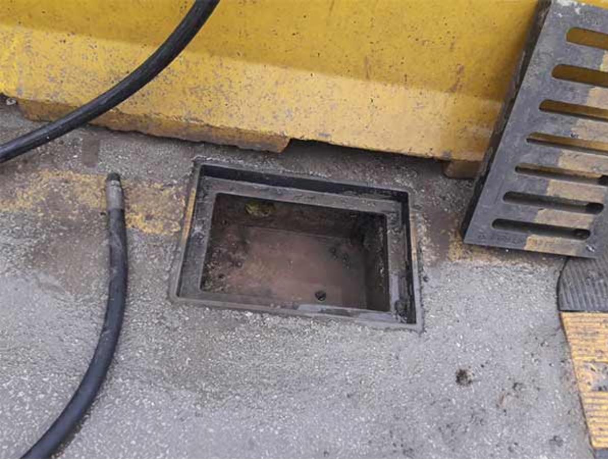
Kanal Tıkanıklığı Açma 10. Aşama